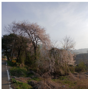
▲ 오디관에서 본 수양 산벚꽃